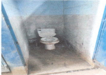
Foto1: Sustitución de inodoro