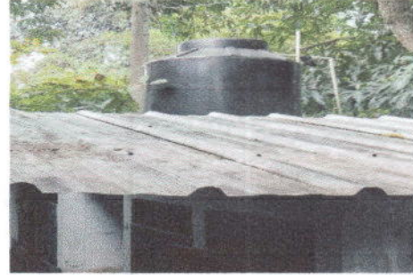
Foto 8: Sustitución de lámina, por lámina troquelada aluzinc calibre 26