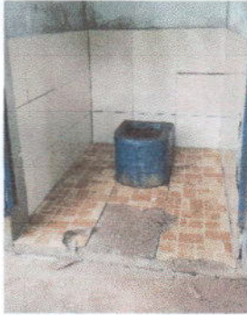
Foto7: Sustitución de azulejo