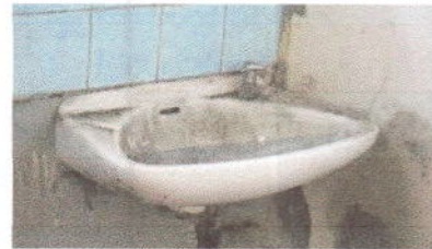
Foto: 2 sustitucion de lavamanos