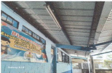
Foto 11: Sustitución de lámparas tipo LED, Reparación de cableado eléctrico

Observación: Si es necesario se pueden agregar hojas adicionales y actualizar el número de hojas.